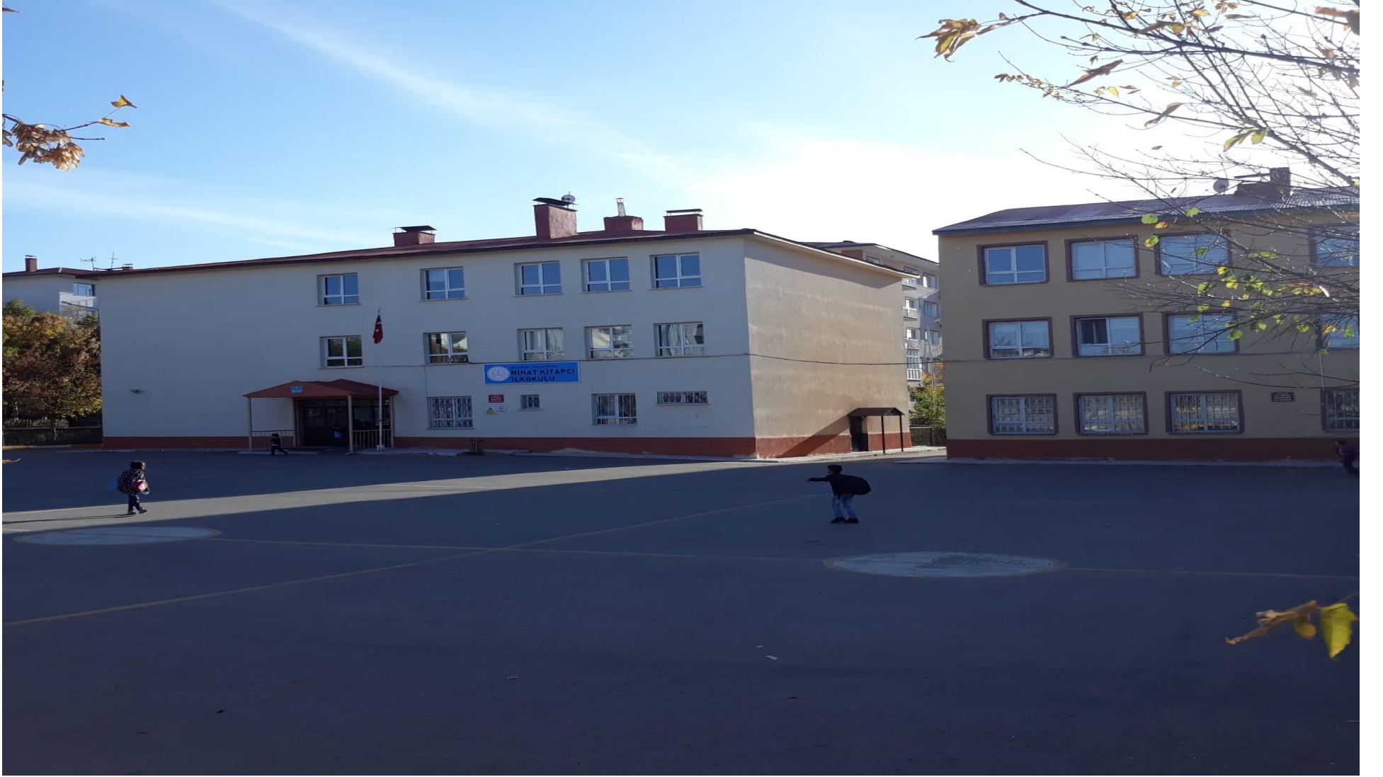
NİHAT KİTAPÇI İLKOKULU